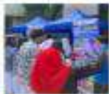
OPEN BOOTH Kannada / Hindi