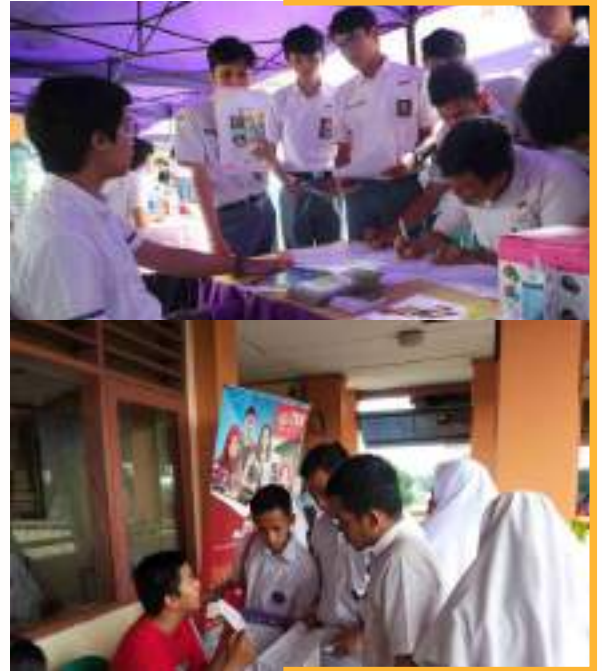
Open Booth Kampus

Open Booth Kampus dilaksanakan langsung di area sekolah (lapangan/selasar) tergantung dengan kondisi sekolah.