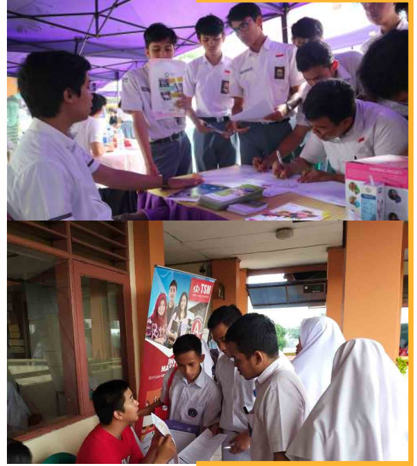
Open Booth Kampus

Open Booth Kampus dilaksanakan langsung di area sekolah (lapangan/selasar) tergantung dengan kondisi sekolah.