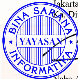
Naba Aji Notoseputro